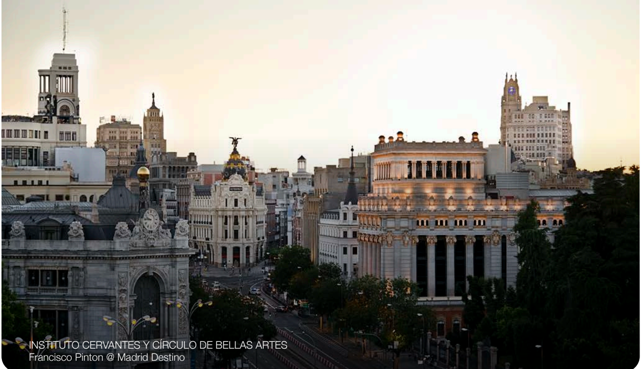
INSTITUTO CERVANTES Y CÍRCULO DE BELLAS ARTES Francisco Pinton @ Madrid Destino