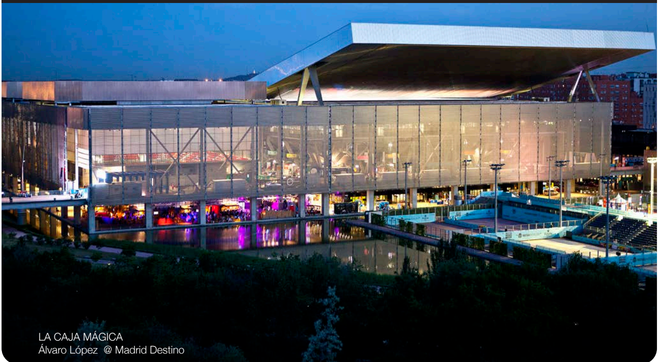
LA CAJA MÁGICA